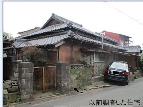
以前調査した住宅