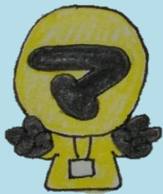
ケアマネイエローさん

思春期の娘との会話がなかったんですが、このブルーレイを見ていたら娘の方から「すごい事やってんじゃん。マジ感動」と話しかけてくれました。