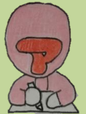
ケアマネピンクさん