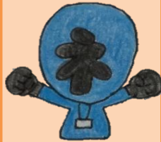
ケアマネブルーさん